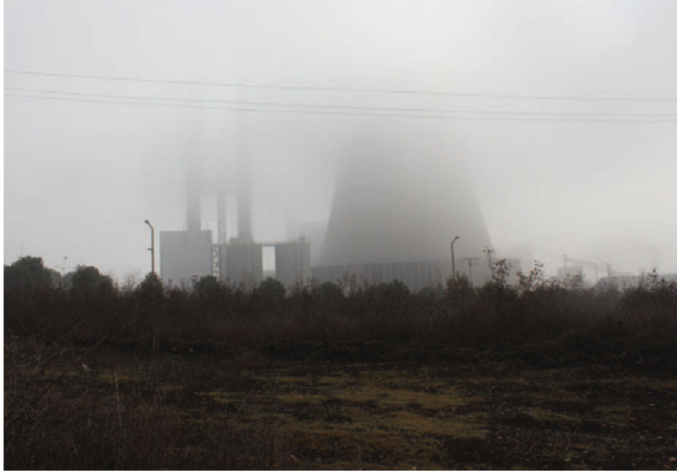
Çan'daki Termik Güç Santrali

Bu araştırma, Çanakkale'nin Çan bölgesindeki kömürlü termik santrallerin yerel kadınların günlük rutinlerini nasıl etkilediğini anlamayı amaçlıyor. Termik santral inşaatlarına ve çevreye zarar veren diğer projelere rağmen kadınların ihtiyaçlarını ve görmek istedikleri toplumun dinamiklerini saptamaya çalışıyor. Bu çalışmada güncel literatür çalışmaları (akademik yayınlar, sivil toplum raporları), röportajlar ve konuyla ilgili ek bilgi yöntemleri (belgeseller, basın makaleleri vb.) kullanıldı. Saha çalışmasına ek olarak kasabada yaşayan kadınlarla derinlemesine görüşmeler yapıldı.